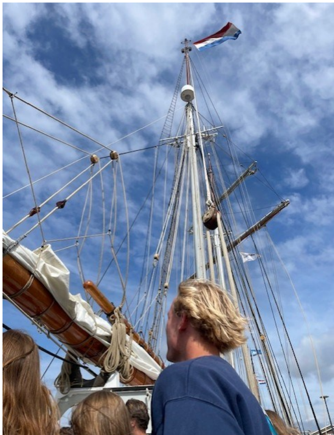
Met twee joekels van masten is de boot 43 m hoog

De slaapzaal bestaat uit 'bunkers' en hangmatten, die niet helemaal bedoeld zijn voor mensen groter dan 1.90 m (dat ben ik wel).