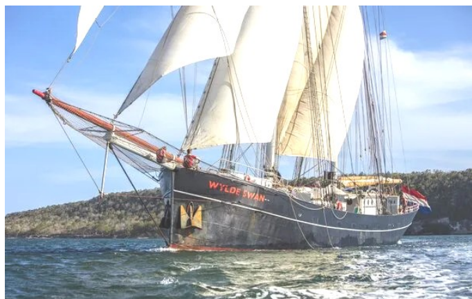
Tallship "De Wylde Swan"

Begin dit jaar schreef ik voor het eerst iets in deze nieuwsbrief van de Watersportvereniging over mijn plan om met Masterskip mee te gaan doen. Voor wie niet weet wat dat is: dan ga je een paar weken lekker zeilen in de Carib en ondertussen krijg je les aan boord! Zo'n leuke trip is helaas niet gratis. Van mijn ouders moest ik tweederde van het bedrag zelf bij elkaar verdienen. Dat komt neer op € 5,600.00. Dat is inclusief de vliegreis naar Sint Maarten, waar ik op 15 december aan boord ga van Tallship De Wylde Swan.