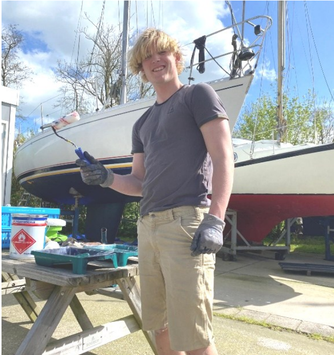
Werken aan het zeiljacht "Honeymoon"

Voor mijn leraar geschiedenis heb ik foto's gemaakt van de rivier de Luts. En ik heb een buurman geholpen om zijn tuin te snoeien en het gras te maaien, voordat hij en zijn vrouw een jaar lang door Australië gingen reizen. Iets wat mij zelf ook superleuk lijkt om te doen! Ook verdiende ik geld op het feest dat mijn moeder gaf vanwege haar 50ste verjaardag. Ik mocht de chef-kok helpen met het klaarmaken en uitserveren van het diner.