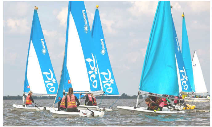
De Laser Pico in actie

De Laser Pico heeft een standaard zeiloppervlakte van 5,1 m 2 en er kan een fok worden gevoerd met een oppervlakte van 1,09 m 2 en bij wedstrijden wordt het zeil met de oppervlakte 6,44m 2 gebruikt. De Laser Pico is gemaakt van polyethyleen en zo doende zeer bruikbaar als zeilschoolboot.