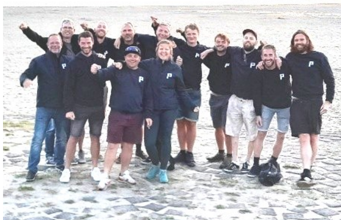
Het "Hoop op Zegen" team

Het mooie aan het zeilen op een skûtsje is, dat je dat met een heel team moet doen. We zeilen namelijk met 14 mensen op het schip. Iedereen heeft zijn eigen taak waarbij we allemaal een radertje van het geheel zijn. Je moet met zijn allen samenwerken om het schip goed vooruit te krijgen en daarom trainen we regelmatig op het Slotermeer.