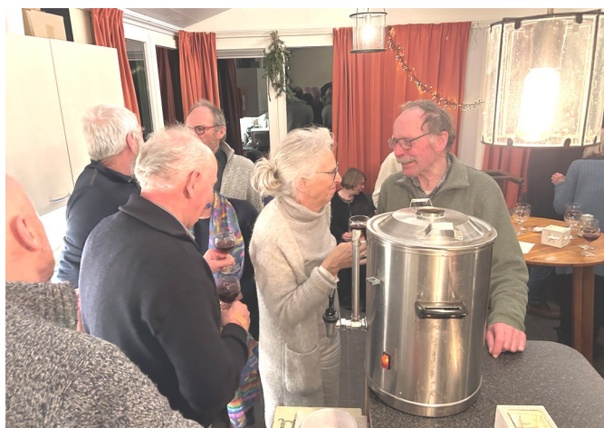
De kan met glühwein was snel leeg

Op zaterdag 4 januari j.l. geurde ons clubhuis naar oliebollen en glühwein. Met circa dertig leden werd er geproost op het nieuwe jaar. Dat de aanwezigen hongerig waren bleek al snel, want binnen de kortste keren waren alle oliebollen op. Ook de zeven liter glühwein volgde hetzelfde lot als de oliebollen. Begrijpelijk want om 16.00 uur zijn Fedde, Marten en ondergetekende begonnen met het maken van de glühwein. Alcohol verdampt bij 78,4°C dus met veel geduld de wijn langzaam verwarmd (want er moet wel een beetje alcohol in blijven) en aangevuld met sinaasappel, kaneelstokjes, anijs en wat bruine suiker. Natuurlijk moesten de bereiders van deze godendrank steeds wel even proeven of de kwaliteit wel zou voldoen aan de WSV eisen.