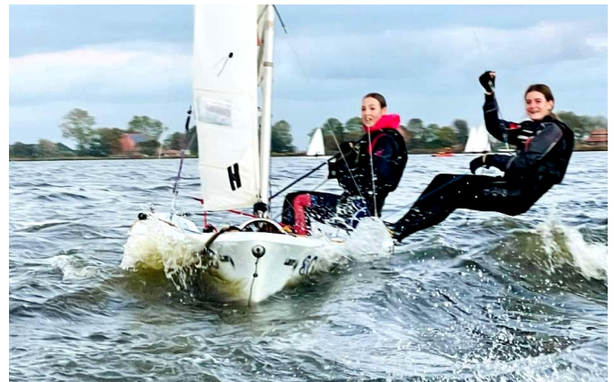
Laser Vago in actie

De Laser Vago is ook van polyethyleen. Deze sportieve boot heeft naast een grootzeil en een fok ook nog de beschikking over een gennaker. Tevens is er een trapeze aanwezig. Er zijn verschillende zeilcombinaties mogelijk. Standaard bestaat dit uit een grootzeil van 8,00 m 2 , fok 2,66 m 2 en gennaker 11,38 m 2 . In de race-uitvoering heeft de Laser Vago een grootzeil van 9,32 m 2 , fok van 2,66 m 2 en een gennaker van 13,00 m 2 . Door de polyethyleen romp is ook deze boot zeer geschikt als zeilschoolboot.